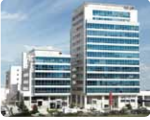
Merkez / Head Office